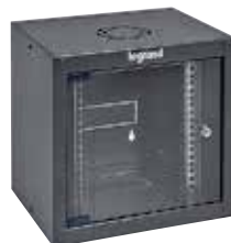
6 462 30