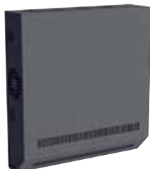
6 462 40