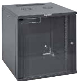
6 462 62